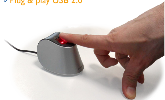
BioMini die een vingerafdruk sjabloon registreert

De BioMini kan worden gebruikt om vingerafdruk sjablonen te registreren en deze vervolgens naar de terminals te sturen. De BioMini wordt ondersteund door de bijhorende registratie software. De BioMini heeft een moderne uitstraling en is gemakkelijk te installeren door middel van Plug & Play.